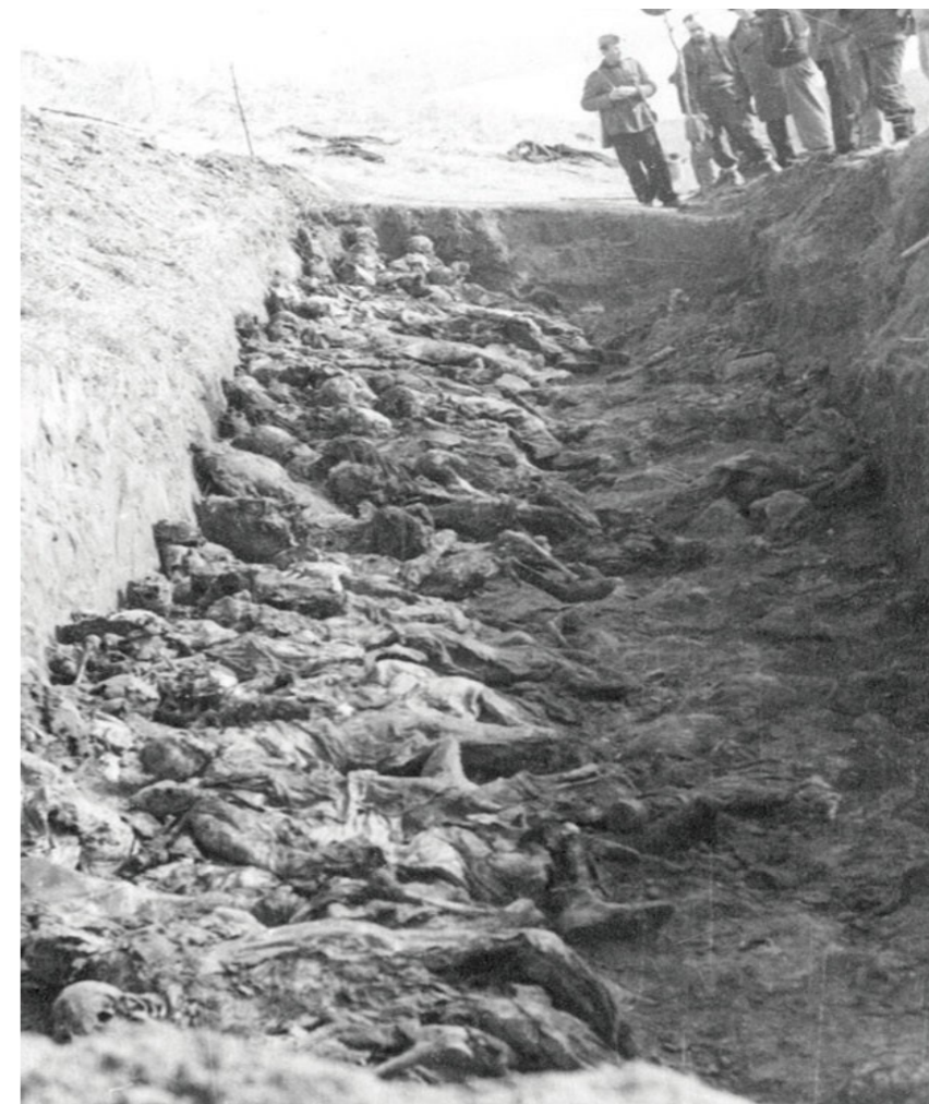
Ексхумација жртава – Бежанијска Коса, 1944.г.