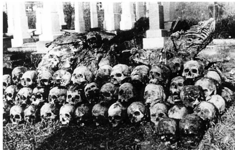
Ексхумација српских жртава на Јеврејском гробљу у Земуну 1944.г.

“Ми нисмо ни четници ни партизани, тако се делимо ми. За непријатеље смо сви ми исти – сви смо „логораши“, логорашка нација! Зато о историји Срба треба – поред четничког, устаничког, партизанског или ратничког и побуњеничког, у сваком случају митоманског искуства и суда – треба саслушати и проучити искуство логорашко, да бисмо то искуство уградили у нашу веру, душу и виталност заједнице.“