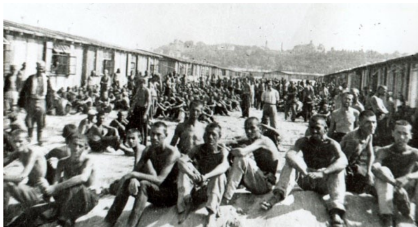
Заточеници Прихватног Логора Земун 1943.г.

Нека она буде место нашег окупљања сваке године, друге суботе у Мају месецу!