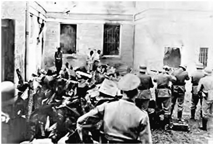
Стрељање омладине у логору Земун 1943.г.

Током нешто више од две године постојања Прихватног Логора Земун, мртви су редовно одвожени, углавном ноћу, запрежним колима и насумично покопавани на земунском гробљу, на више од 20 локација, у Белановића рупи на Бежанијској Коси, а многи и директно бацани у Саву. Записане су изјаве сведока да су калдрмисане земунске улице ноћима током рата биле кржаве потоцима који су се сливали низбрдо, и да је често у колима било још живих људи који су потом били живи закопавани.