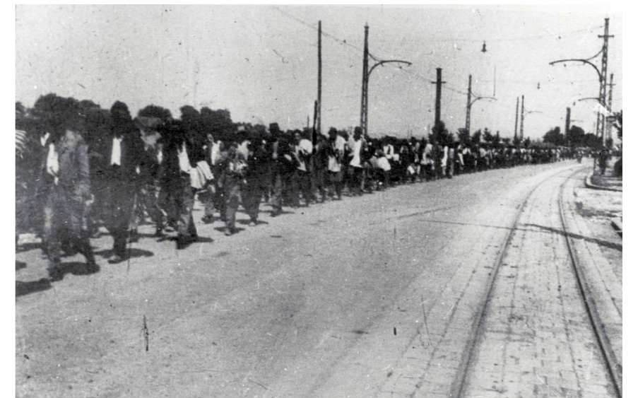
Транспорт Срба са Козаре у Земунски логор смрти – лето 1942.г.