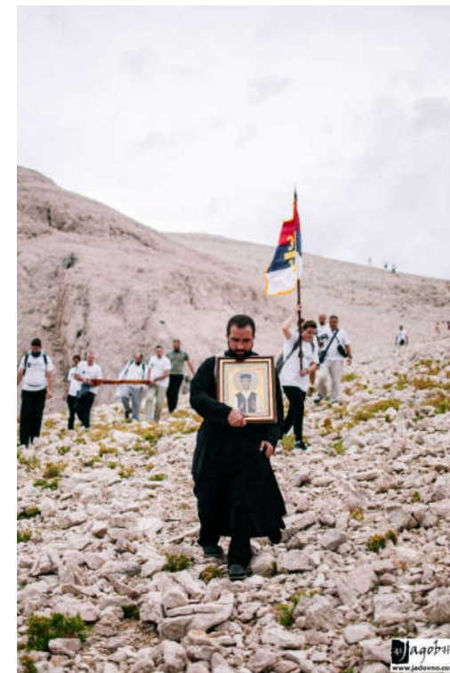
Члены ассоциации «Ядовно» несут Святой Крест на мыс Слана, в память о сербах, погибших на острове Паг в 1941 году.