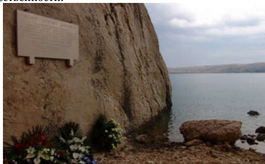
Мемориальная доска на мысе Слана, остров Паг, в память о не менее 8000 жертв, трижды установлена и снесена 1991, 2010 и 2013 годах. Не реставрирована по сей день.

Уже в мае и начале июня усташские и другие хорватские вооруженные силы начали привозить на поездах в вагонах для скота сотни захваченных мужчин, женщин и детей, в основном сербов, но также и евреев, со всей территории НГХ. Территория лагеря Госпич вскоре стала слишком тесной, и Министерство внутренних дел НГХ, во главе с Андрией Артуковичем, создало четыре новых лагеря в Велебитской глуши и на острове Паг, образуя комплекс лагерей смерти Госпич-Ядовно-Паг, вдали от глаз общественности.