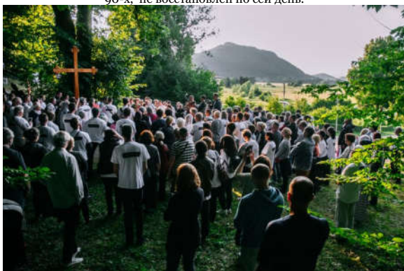
Смильян, 30 июня 2018. Установка Святого Креста рядом с братской могилой.