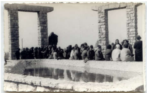
«Виселица», работа скульптора Вани Радауша, центральный памятник жертвам группы лагерей Госпич, установленный в 1961 году, недалеко от православного кладбища в Ясиковце возле Госпича. Разрушен во время войны 90-х, не восстановлен по сей день.