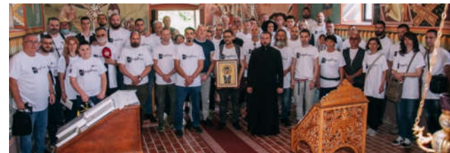
Смильян, Лика 19 июня 2021 года в День памяти Ядовно 1941.

Лагерь смерти «Ядовно» возник в первой половине мая 1941. года на Велебите, 22 км к северо-западу от Госпича, на поляне Чачич-долац, на высоте 1200 м над уровнем моря, в глубине леса под ясным небом, на поверхности длиной 50 метров и шириной 25 метров. В начале июня, эта площадь была расширена до 90 x 70 м, а 24 июня до окончательного размера 180 x 90 м, и огорожена двойной колючей проволокой высотой 4 метра. Рядом находится одна из карстовых ям, где усташи убивали своих жертв.