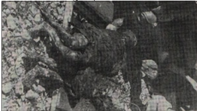
Тијела двије дјевојчице ексхумирана од стране Италијана на острву Пагу