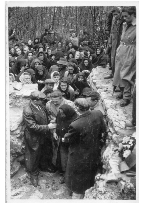
Породице жртава код Шаранове јаме - 1957. година