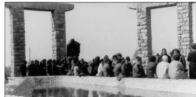
Језеро суза - централно спомен обиљежје на гробљу Јасиковац код Госпића

Госпић, сабирни логор Ступачиново на Башким Оштаријама и бројне бездане јаме Лике, Велебита и подвелебитског подгорја.