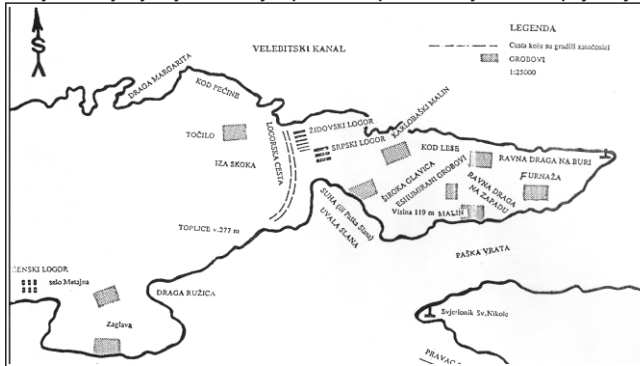
Скица логора на острву Пагу