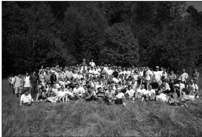
Чланови УГ Јадовно 1941, потомци и поштоваоци жртава са Часним Крстом, узнесеним Мученичком Стазом Јадовничком и постављеним на мјесту логора Јадовно на Велебиту, 24.06.2012.