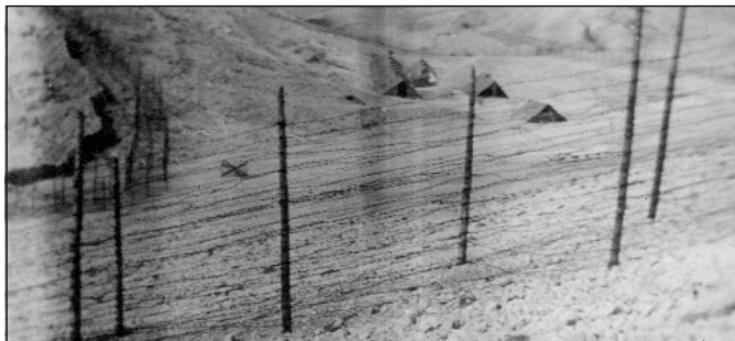
Италијанска фотографија: логор за Србе у ували Слана, на острву Пагу

Већ у априлу 1941. године, власти Независне Државе Хрватске низом законских одредби, озакониле су злочин и почеле са оснивањем концентрационих логора: „Даница“ код Копривнице, „Керестинац“ код Самобора и „Госпић“ у Лици. Ови логори били су организовани знатно прије 2. јуна, када је поглавник Анте Павелић издао званично наређење о оснивању логора у Независној Држави Хрватској. Усташе, уз подршку и помоћ локалног хрватског становништва, почеле су већ сутрадан након проглашења НДХ, дакле 11. априла, хапсити Србе Госпића и околине, те их уз жестоке батине затварати у казнионицу Окружног суда (тзв. Герихт) и њено ограђено двориште, гдје је краће вријеме могло боравити 2.500 – 3.000 заточених људи. Већ током маја и почетком јуна, усташе и остале хрватске војне и полицијске снаге, почеле су са цијелог подручја НДХ довозити стотине и стотине новопохватаних мушкараца, жена и дјеце, Срба и Јевреја. Простор концентрационог логора Госпић убрзо је постао премален, па је Министарство унутрашњих послова НДХ, на челу са Андријом Артуковићем, на велебитској забити и на острву Пагу, далеко од очију јавности, основало нова четири логора, формирајући комплекс логора смрти Госпић -Јадовно - Паг.